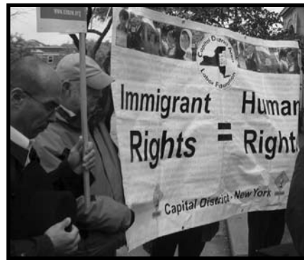
Orando por soluciones morales

Las escrituras Hindu Taitiriya Upanishad nos dicen "El visitante es un representante de Dios." (1.11.2)